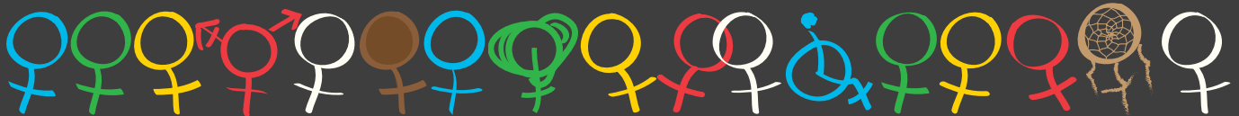
Illustration: Chantal Locat

Coordination du Québec de la Marche Mondiale des Femmes CQMMF